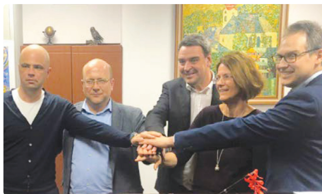
Після підписання Меморандуму про співпрацю 29.03.2019