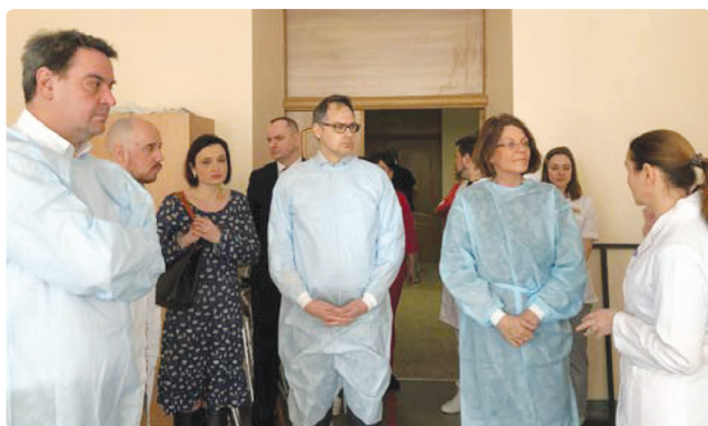
Відвідини австрійськими колегами відділення нейрореабілітації Київської обласної клінічної лікарні 29.03–30.03.2019

У місті Ліон (Франція) 3 травня 2022 р. відбувся 8-й щорічний семінар, організований комітетом ESO EAST, у якому взяли участь